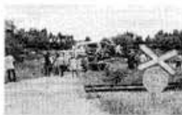
Alcácer do Sal, Abril de 2007

A 27 de Abril de 2007, uma carrinha avaiou em cima de uma passagem de nível, em Alcácer do Sal. A condutora morreu atingida pelo carro, projectado pelo comboio.